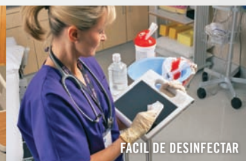
FÁCIL DE DESINFECTAR